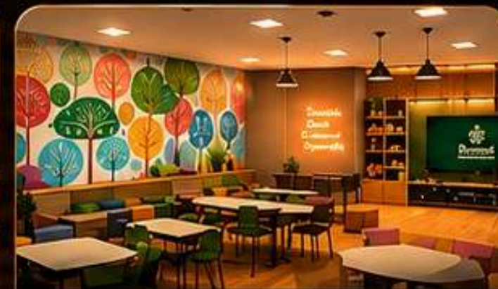
ATL E ACOMPANHAMENTO ESCOLAR