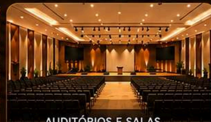
AUDITÓRIOS E SALAS DE FORMAÇÃO