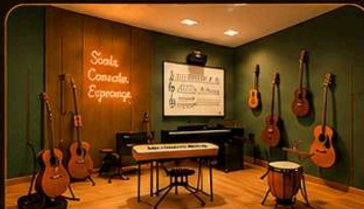
ESCOLA DE MÚSICA