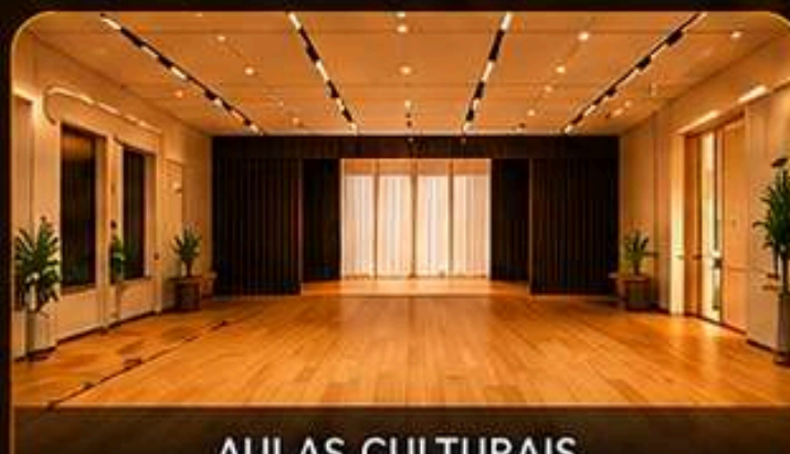
AULAS CULTURAIS (TEATRO, DANÇA, ETC.)