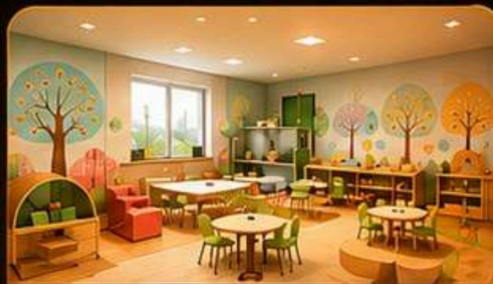
CRECHE E DAY CARE

Este espaço será também o templo da CCR Almada um lugar de fé, comunhão e esperança , que fortalece e inspira toda a ação social desenvolvida.